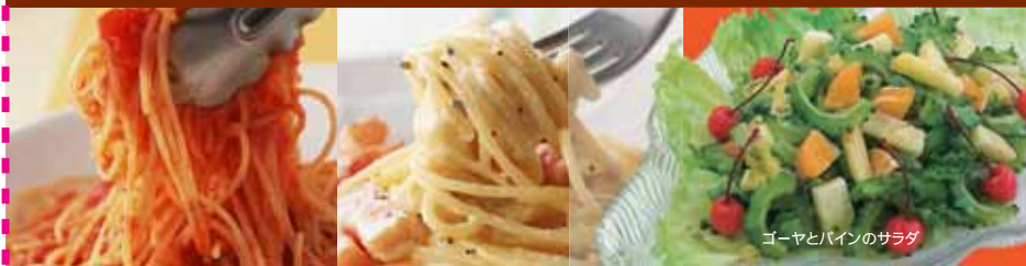
ゴーヤとパインのサラダ