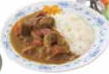
定番カレーも大人気！