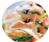
パイパイちゃんぶるー