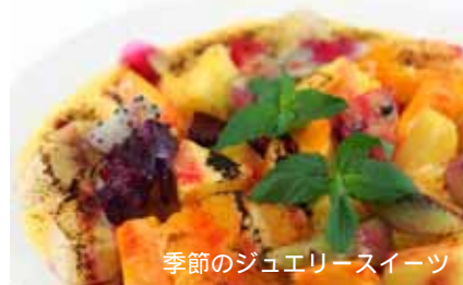
季節のジュエリースイーツ