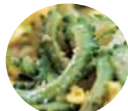
ゴーヤちゃんぶるー