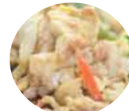
ぶーちゃんぶるー