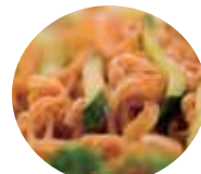
豚ミミガーキムチ和え