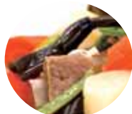
大根とソーキのうぶさー